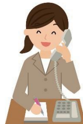
近畿日本ツーリスト